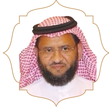
محمد بن هادي بن حسن الرفيدي نائب الرئيس