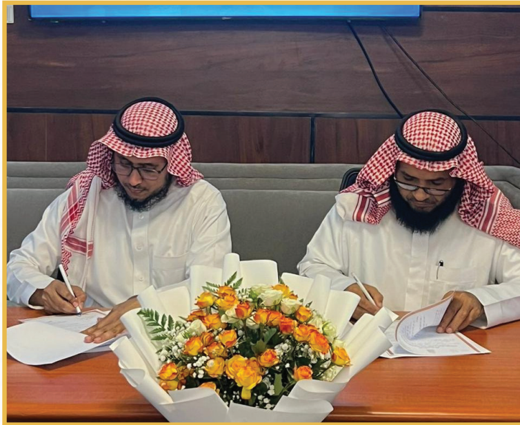
شراكة مجتمعية مع جمعية البر الخيرية بالقنفذة