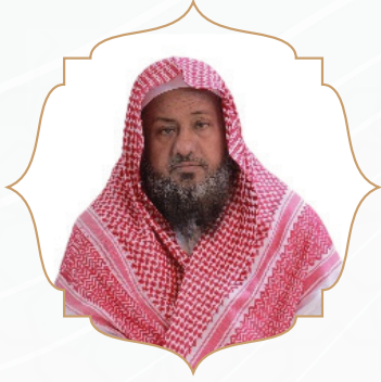
الشيخ / عبدالله بن درويش بن محمد الفقيه نائب الرئيس