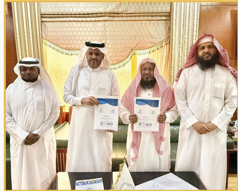
توقيع اتفاقية شراكة مجتمعية مع بلدية محافظة القنفذة